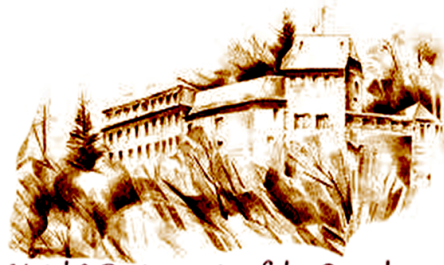
Hotel & Restaurant auf der Kreuzburg

Wir freuen uns, Sie als unsere Gäste begrüßen zu dürfen und wünschen Ihnen einen angenehmen Aufenthalt in unserem Haus.